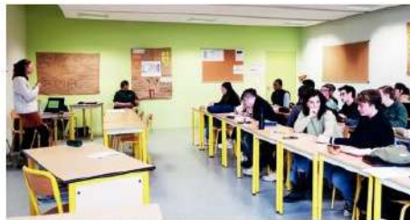
Intervention à la MFR de l'Orléanais dans le cadre du forum installation

MFR de l'Orléanais le 1 er février, le second au Lycée agricole du Chesnoy le 2 février. En quête de réponses sur leur avenir professionnel, les jeunes ont notamment