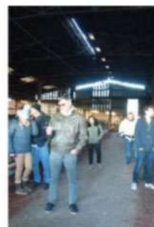
Les discussions se sont prolongées tout au long de l'après-midi.