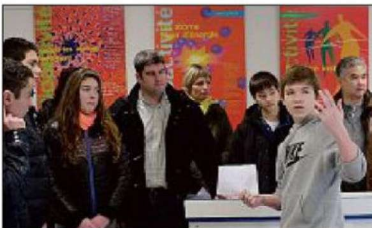
Pour en savoir plus sur les filières d'enseignement et d'apprentissage.

Vendredi 10 mars aura lieu au complexe sportif du Château-Blanc, à Villemandeur, le forum de l'orientation , pour les élèves de 3 e des collèges du Gâtinais, qui pourront rencontrer les professionnels de nombreux secteurs d'activités ainsi que les établissements scolaires et centres de formation post-collège. De 16 h 30 à 19 heures, le forum s'ouvrira à tous les publics, en premier lieu les familles des jeunes.