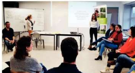
Echanges avec des élèves adultes du lycée horticole La Moulière à Orléans.