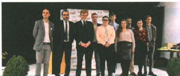
Accompagné du ministre Marc Fesneau et des directeurs de l'EPL* et du CFA, Anthony Paris a récompensé les meilleurs apprentis de France scolarisés à Bellegarde, vendredi 25 novembre.

Avec des effectifs en hausse constante depuis quelques années, l'apprentissage séduit de plus en plus de jeunes. Un phénomène qui a conduit le CFA à s'adapter sous la précédente mandature pour accueillir aujourd'hui près de 400 apprentis. «Les aides