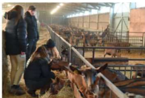
Les apprenants de la MFR de Gien et du CFA de Bellegarde ont participé à deux ateliers : un auprès des chèvres, l'autre auprès des vaches.