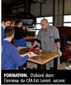
FORMATION. D'abord dans l'annexe du CFA Est Loiret.

Ce samedi, portes ouvertes de 8 h 30 à 13 heures au CFA Est Loiret à l'annexe de la zone